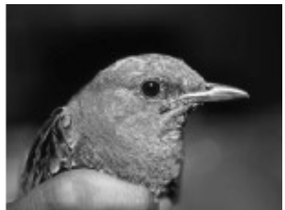
写真11. イソヒヨドリみ.