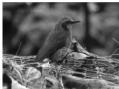
写真3. リュウキュウヒヨドリ.

最初の内は桑の実やアコウの実などの木の実をついでに食べていました。その後、お正月のしめ縄のミカンにも訪れるようになりましたが、これらは日常的に人里で繰り広げられる光景でしょう。ところが、ある日突然、畑のプロッコリーの葉に数羽のリュウキュウヒヨドリが群がり始めました。ある畑では、見る