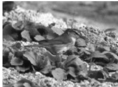
写真2. カラフトムジセッカ.