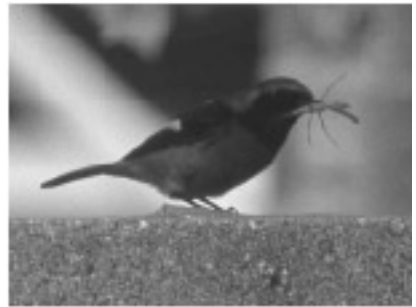
写真7. ジョウビタキみ.